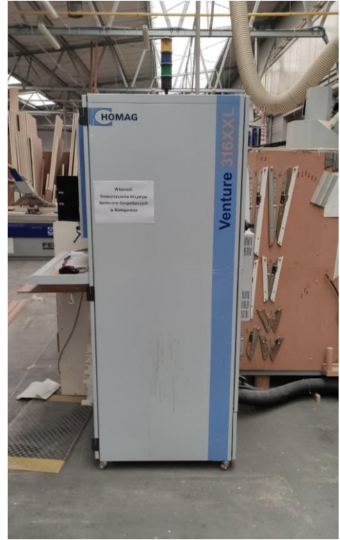
Fot. 5. Szafa sterownicza