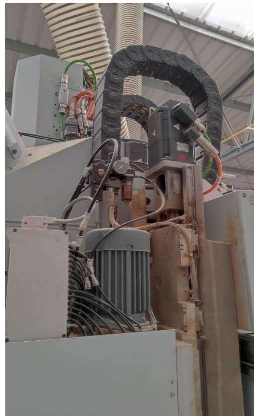
Fot. 8, 9, 10, 11. Elementy robocze maszyny wraz z elementami napędu i odciągami pyłu