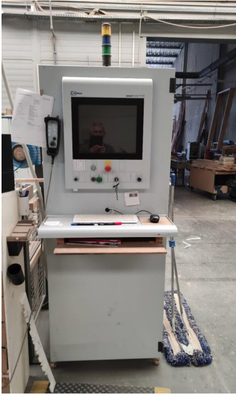
Fot. 4. Pulpit operatora