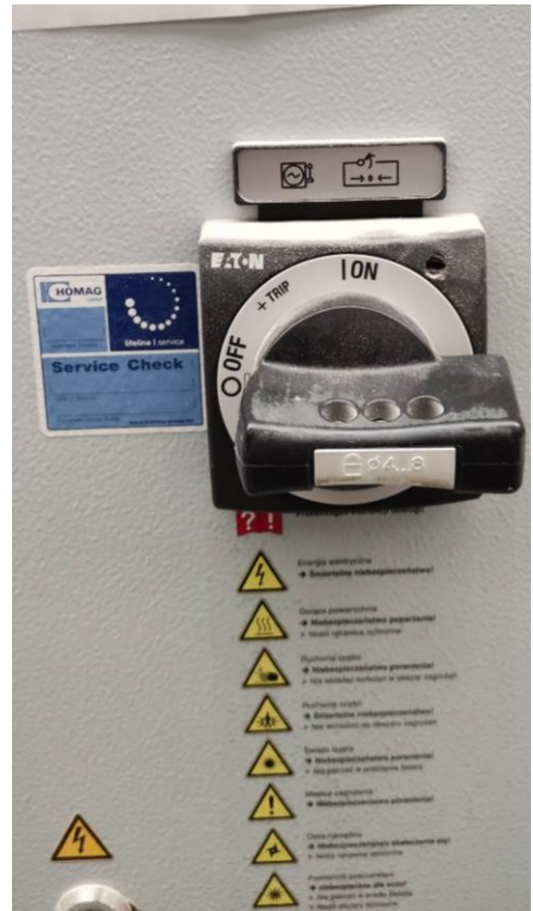
Fot. 6, 7. Tył szafy sterowniczej z wyłącznikiem zasilania