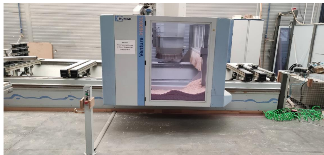
Fot. 1, 2, 3. Widok ogólny maszyny