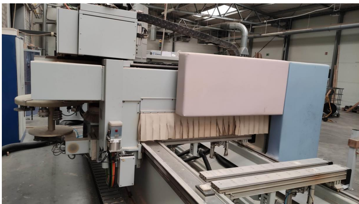
Fot. 17. Stół maszyny, system odbioru produktu.