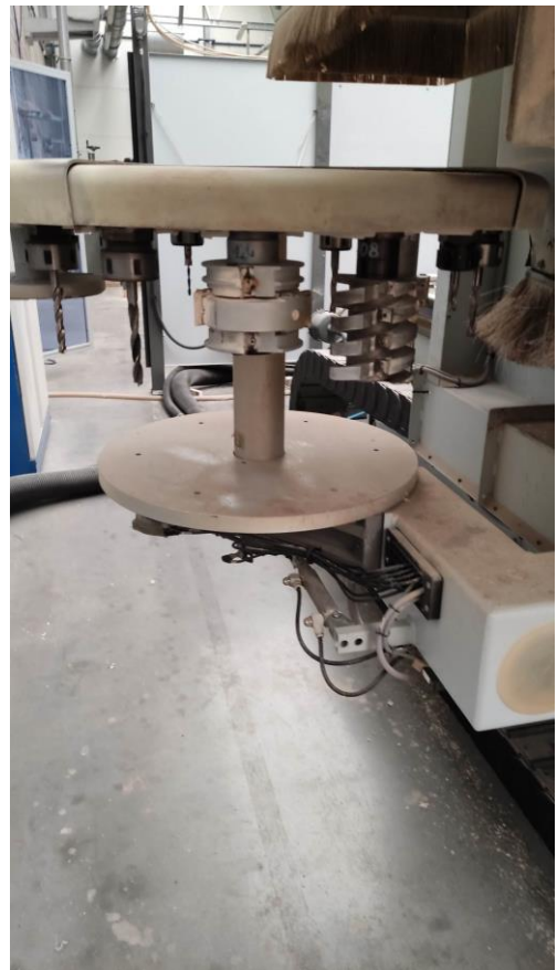
Fot. 12, 13, 14, 15. Elementy robocze maszyny wraz ze stołem i podstawkami pod materiał